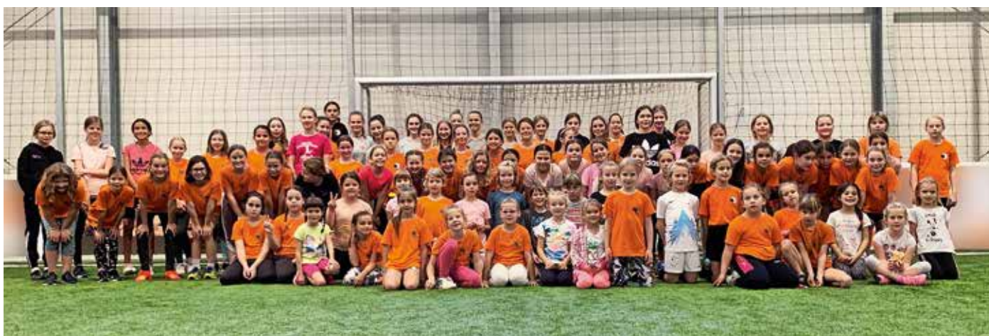
Igralni dan za nogometašice iz interesnih dejavnosti