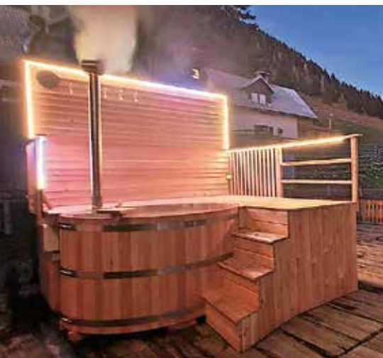
Vročna kad / Foto: osebni arhiv

Maria Mia Grilc pravi, da je želela postati zdravnica, a jo je življenje zapeljalo po drugih poteh, med drugim tudi med zdravilne rastline, predvsem pa k eko turizmu (Viženčar) in pridelavi ekološke hrane. Želja po izobraževanju jo je privedla do refleksoterapije, postala je Reiki mojstrica – naravno zdravljenje s terapijami. »Odpravljanje posledic pa mi sčasoma ni bilo več dovolj, želela sem odkriti vzroke za težave, zato sem se leta 2015 vpisala na Feel akademijo, kjer sem se temeljito poglobila v to, kako naša potlačena čustva vplivajo na naše zdravje. Zdaj to prenašam tudi na svoje terapirance, osvobajam jih čustvenih blokad in hkrati sproščam.« Kot je še povedala, je skupaj z njo na Krvavcu rasel mini velnes, ki med drugim vključuje sobo za terapije, fitobočko oziroma zeliščno savno v cedrovem sodčku (njena posebnost je v tem, da je 'glava zunaj') in Yoni divine spa savno. Zadnja pridobitev je vroča kad za štiri osebe na prostem.