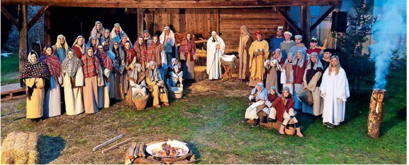
Skupinski posnetek nastopajočih