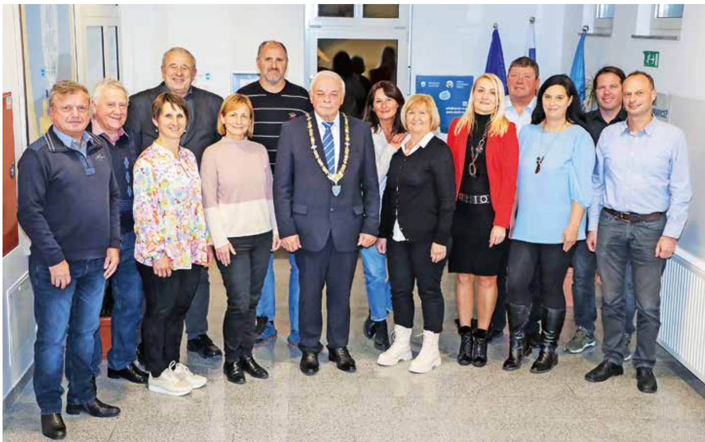
Novi občinski svet po ustanovni seji (trije člani so bili odsotni)

»Zakaj kandidatura? Kot svetnica lahko proaktivno sodelujem pri nadaljnjem razvoju občine Cerklje in ker želim, da naša občina ostane podeželskega duha. To je po mojem mnenju temeljit ključ do kvalitetnega življenja tako skupnosti kot posameznika, hkrati pa pomemben trend za razvoj turizma, ki bo v naši občini ob primernem času doprinesel sredstva, brez težav kot so nemir, pokanje po šivih v kanalizaciji in odpadki. Urejena infrastruktura na visokem nivoju je nadvse pomembna, kajti le takšna bo podpirala sodobno življenje zdaj in naprej. Pomembno je, da težimo le k zadevam, ki bodo za občane