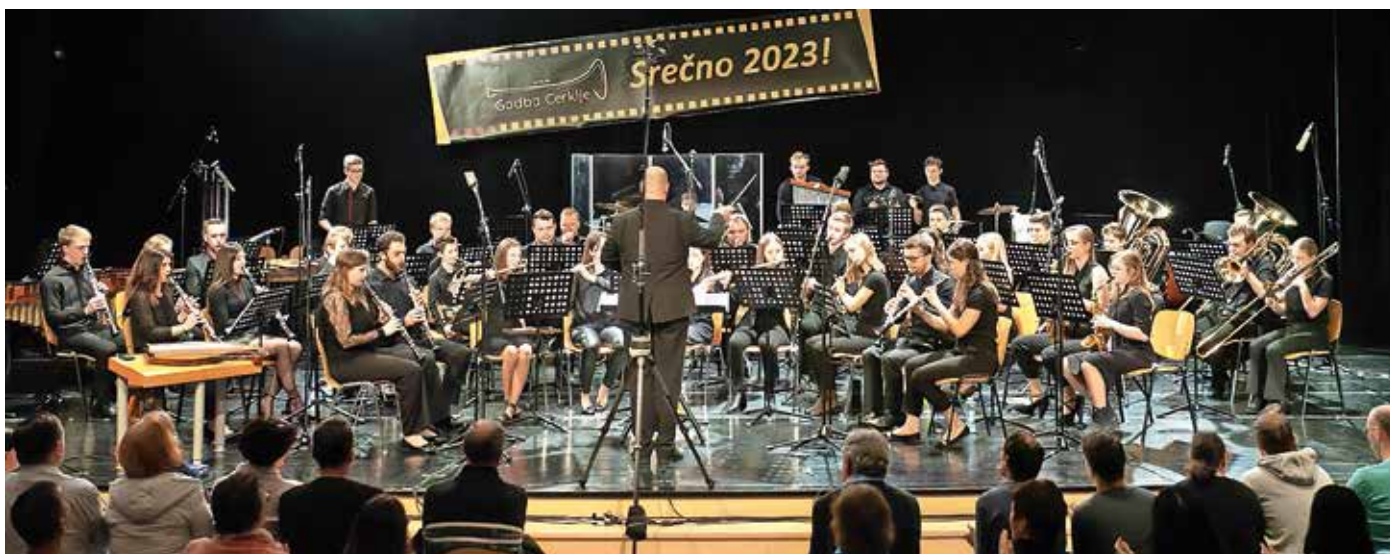
Godba Cerklje na božično-novoletnem koncertu / Foto: Jože Žagar