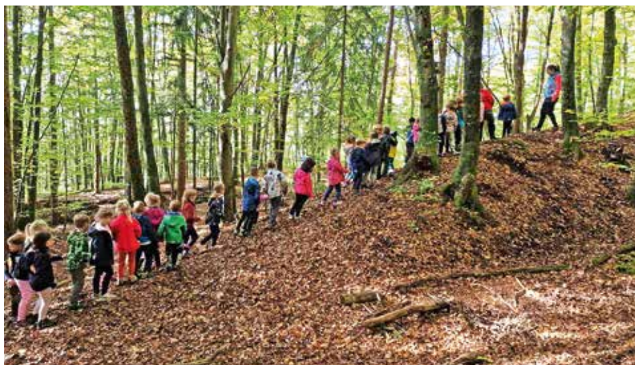
Raziskovanje gozda / Foto: arhiv vrtca

Ti naši radovedneži niti ne potrebujejo veliko posebnih spodbud, da začnejo raziskovati gozd. Kakšna pravljica, sporočilo navihanega gozdnega škrata ali nepričakovana škatla za grmovjem so dovolj, da se v njih prebudita radovednost in nav-