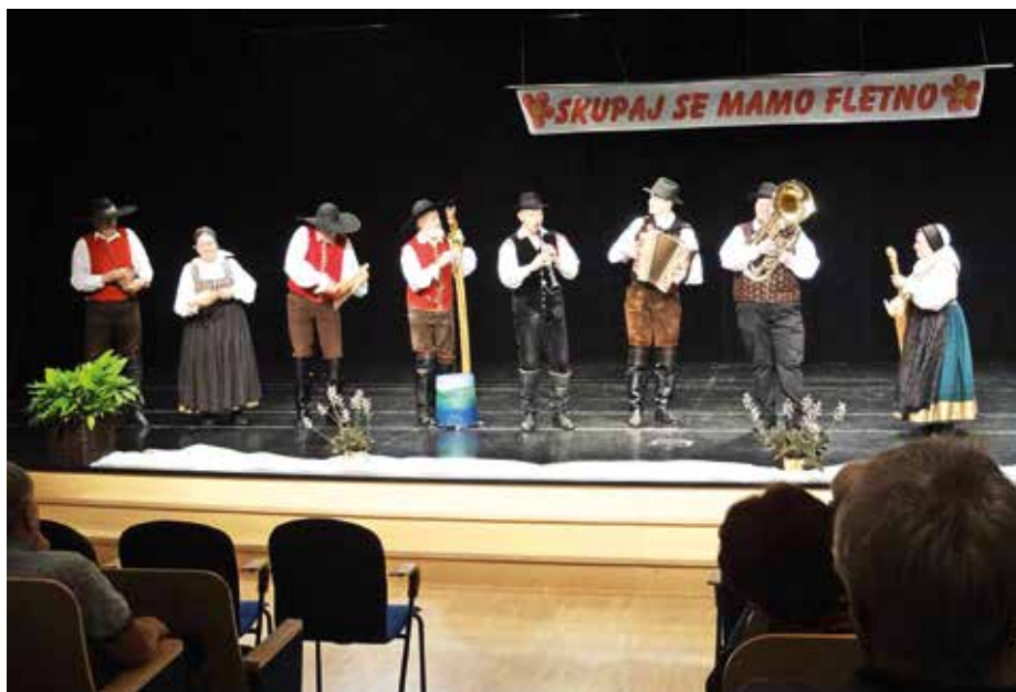
Cerkljanski gavnarji so navdušili polno dvorano.