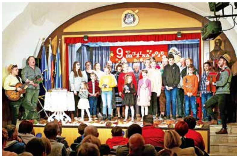
Ob zaključku prireditve so vsi nastopajoči skupaj z občinstvom zapeli Slakovo V dolini tihi.