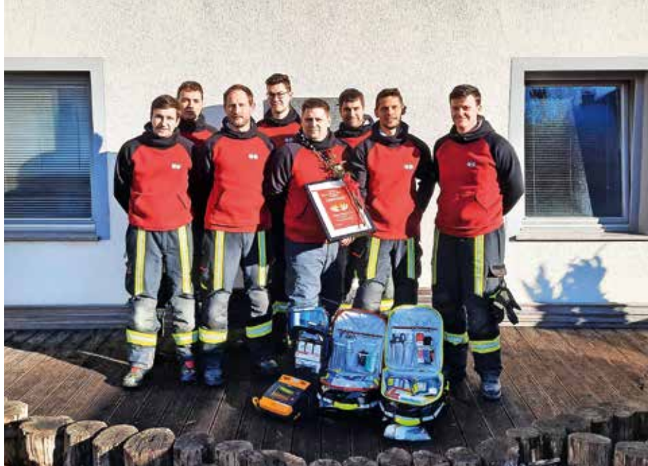
Ekipo prvih posredovalcev PGD Zalog

Osem članov Prostovoljnega gasilskega društva (PGD) Zalog pri Cerkljah se je usposobilo za prve posredovalce, kar pomeni, da jih lahko dispečer na številki 112 ali dežurni zdravnik vključi v posredovanje v primeru srčnega zastoja, pri večjih krvavitvah, zapori dihalne poti, ob bolečinah v prsnem košu in sumu na možgansko kap. »Za nudenje pomoči smo se usposobili zaradi zagotavljanja dodatne varnosti vaščanov oziroma možnosti hitrejšega ukrepanja na območju, ki ga pokriva. Nujna medicinska pomoč Kranj je od naših krajev oddaljena od 15 do 20 minut, zato je smiselno, da so aktivirani tudi za pomoč usposobljeni gasilci z ustrežno opremo. Kot prvi posredovalci lahko izboljšamo možnost preživetja v situacijah, kjer so prve minute najpomembnejše, na primer pri srčnem