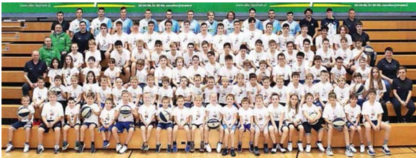
Igralci in vodstvo ŠD Krvavec