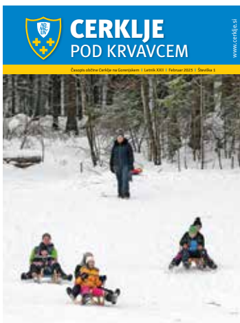
Zimske radosti