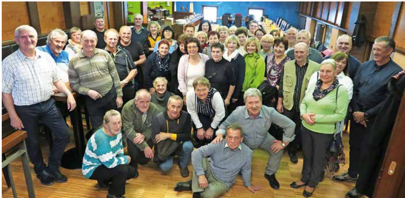
Dobro obiskano peto srečanje po zaključku osnovne šole