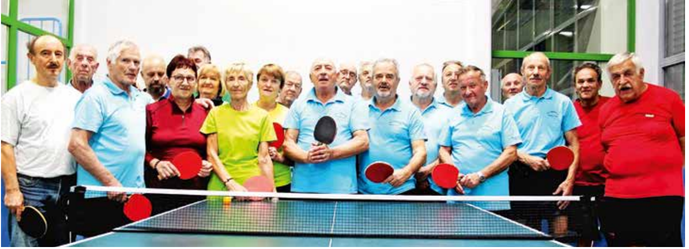
Ekipa, ki igra namizni tenis / Foto: Janez Kuhar