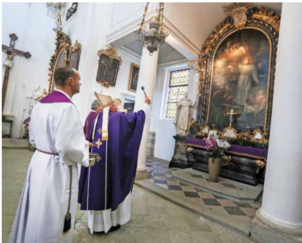
Blagoslov obnovljenih oltarjev v cerkvi Marijinega oznanjenja