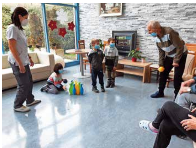
Medgeneracijsko druženje

»Človeku ni dobro samemu biti,« je zapisano v knjigi vseh knjig. Človek od nekdanje hrepene po bližini, po pozornosti. Je bitje odnosa. Duša, če je osamljena, trpi. Vedno znova išče bližino, širi roke in vabi v objem. Zato je prav, da otrokom že v najnežnejši dobi privzgojimo socialni občutek za druge generacije, za drugačne, bolne, ostarele – da vsaj za trenutek omilimo morebitno osamljenost, občutek odrinjenosti, včasih tudi zapuščenosti vseh tistih, predvsem starih ljudi, ki bivajo v domovih za starejše. S tem namenom Medvedki v letošnjem vrtčevskem letu dvakrat mesečno prestopamo prag Doma Taber – da na povsem preprost način, skozi pogovor, nežen stisk roke, igro ..., pokažemo, da nam ni vseeno in da nismo pozabili nanje. Z nežnostjo v očeh, s pristno otroško navihanostjo ... privabljamo nasmeh na lica tistih, ki se sicer težko zasmejejo. V trenutku, ko otrok sam začuti,