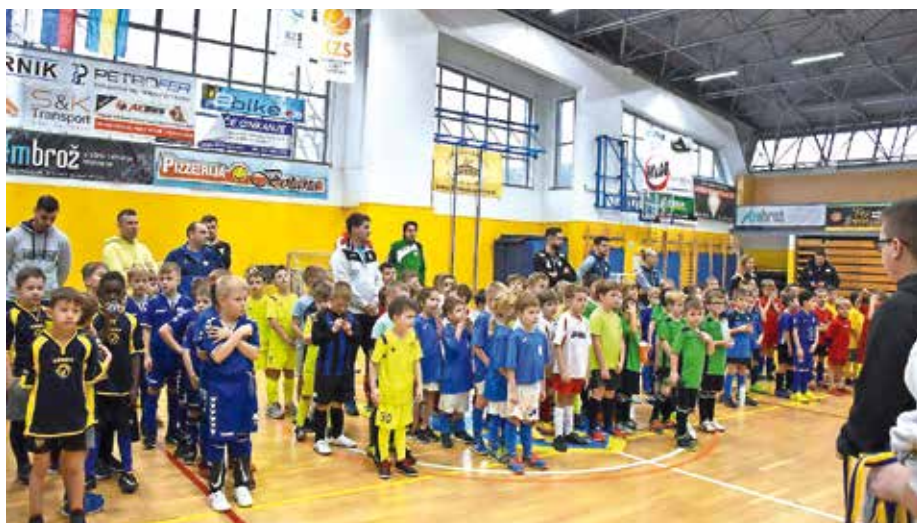
Ekipe, ki so sodelovale v kategoriji U7 / Foto: arhiv kluba

V januarju je po dveh letih v dveh zaporednih koncih tedna občina Cerklje ponovno gostila enega največjih otroških dvoranskih nogometnih turnirjev v Sloveniji, ki ga je organiziral Nogometni klub Velesovo Cerklje. Za odlično organizacijo in brezhibno izvedena tekmovanja smo bili deležni številnih pohval z vseh strani. Gostili smo več kot sto ekip iz celotne Slovenije in več kot tisoč otrok, ki so pokazali svoje znanje in nogometne vragolije. Številni od njih in njihovi starši so bili prvič v naših krajih in glede na to, da smo v obeh koncih tednov po nekaterih ocenah gostili blizu 3000 obiskovalcev, je to pomenilo odlično promocijo tako naše občine kot tudi domačega nogometnega kluba. Najbolj navdušujoč je bil predvsem obisk navijačev, oba konca tedna polne tribune, glasno navijanje in vzorno vedenje vseh gledalcev, ki so skozi celoten turnir športno spodbujali prav vse sodelujoče ekipe.