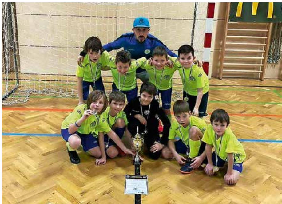
Ekipa U10, ki je zmagala na turnirju v Beljaku