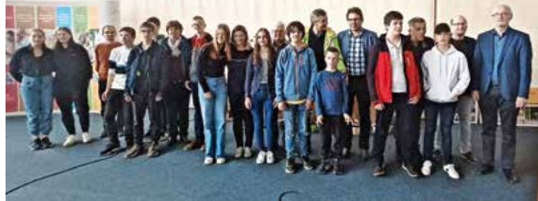
Prejemniki zlatih priznanj – srednja stopnja / Foto: arhiv tekmovanja

Sedmega maja 2022 je bilo tekmovanje organizirano na Biotehniški šoli v Mariboru. Za organizacijo so imeli poseben razlog, saj je šola v tem letu praznovala 150 let kmetijskega izobraževanja. Tekmovanje mladih čebelarjev poteka po različnih krajih Slovenije in vsakič nam prireditelji pokažejo različne lokalne zanimivosti. Letos smo si udeleženci lahko ogledali le del pripravljenega, saj je bila celotna ponudba preobsežna. Ob spremstvu tamkajšnjih dijakov smo si lahko ogledali: šolsko posestvo s sadovnjaki in vinogradi, šolski park, mehanično delavnico in simulator vožnje s traktorjem, šolsko ambulanto za bodoče veterinarje, v terariju smo lahko vzeli v roko različne plazilce, v šolskem rastlinjaku opazovali sisteme za hidroponsko gojenje solate ter si ogledali šolski čebelnjak, vrt medovitih rastlin in prostor za predelavo čebeljih produktov. Velik poudarek tekmovanja je na medse-