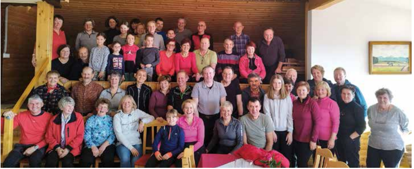
Skupinska fotografija precejšnjega dela jasličarjev